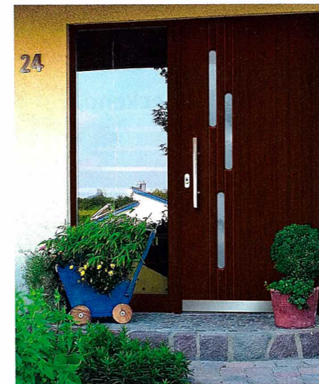
Die energetische Sanierung und das Konjunkturpaket II verhelfen dem Außentürenmarkt zu einer positiven Entwicklung. Dabei sind die Materialgruppen Holz, PVC und Metall fast gleich stark vertreten

Die Zahl der erfassten Wohnungseinbrüche zeigt die Tabelle 1: Besonders wichtig: Erfasst werden auch Einbruchversuche. Durch jahrelange Aufklärungsarbeit der kriminalpolizeilichen Beratungsstellen und Initiativen der Hersteller wurde eine Steigerung der verhinderten Einbrüche auf heute 38 % erreicht. Dieser Wert zeigt deutlich, dass sich die Investition in eine einbruchhemmende Ausstattung lohnt. Der Außentür kommt dabei natür-