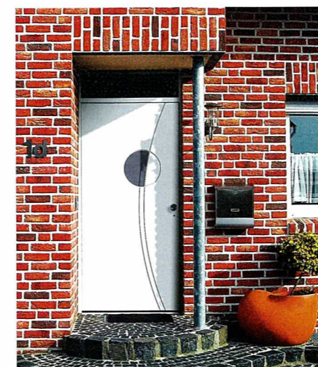
Nach internen Schätzungen wird aktuell jede sechste Tür durch eine Maßnahme begünstigt. Damit ist die Visitenkarte des Hauses nicht nur optisch ansprechender, sondern auch gleich mit dem notwendigen Wärme- und Einbruchschutz ausgestattet